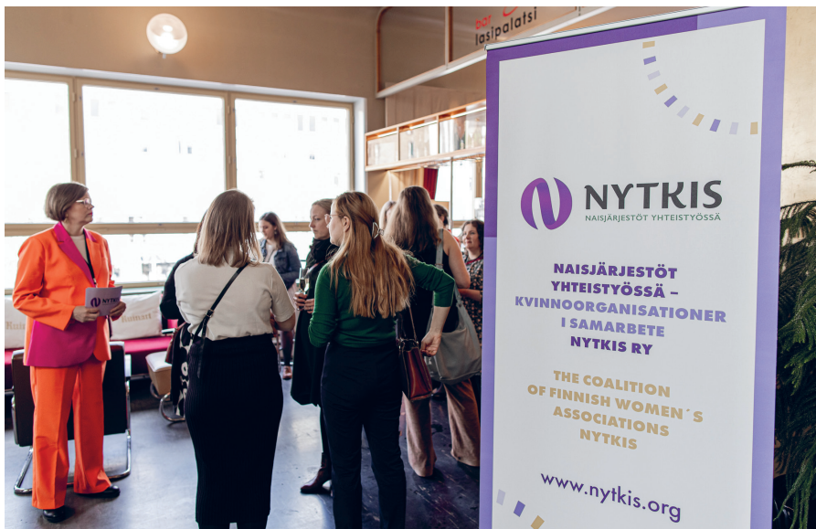
NYTKIS järjesti vuonna 2023 verkostoitumistilaisuuden uusille naiskansanedustajille ja sidosryhmille.

Nytkisin ensimmäisten vuosien kansainvälinen toiminta oli suoraa jatkoa jäsenjärjestöjen aiempien kansainvälisten suhteiden pohjalta. Neuvostoliiton hajoamisen jälkeen Venäjä ei kuitenkaan noussut enää samalla tavalla keskeiseen asemaan Suomen naisjärjestöjen kansainvälisissä suhteissa. YK-tehtävien ohella pääsuunta kääntyi kohti Baltiaa, joskin tämä näkyi paremmin vasta hieman myöhempinä vuosina. Nytkisin teh-