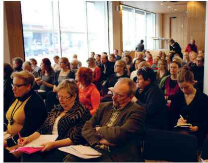
Naistenpäivät ilaisuus vuonna 2013 Eurooppasalissa.

Nytkis-järjestöiltä kysyttiin myös kiistakysymyksistä ja yhteistyön esteistä. Puolueiden naisjärjestöjen mukaan näihin kuuluivat "naisjärjestöjen asema puolueen sisällä, erilainen toimintakulttuuri eri puolueissa, rahoituksellinen riippuvuus, mikä panee tarkkaan miettimään 'irtioton' paikat" sekä "asiat, joissa perinteiset arvot ja uudistusvaatimukset törmäävät" .