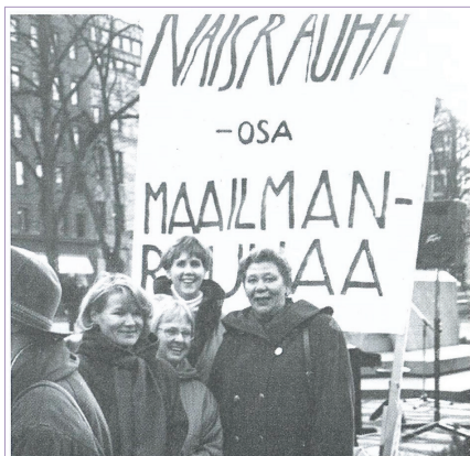
NYTKISin järjestämä Kansainvälisen naistenpäivän tapahtuma Esplanadin puistossa vuonna 1991.

Jugoslavian hajoamissotien raakuudet käyttivät monia 1990-luvun alkupuoliskolla. Naisiin kohdistui raiskauksia ja muuta väkivaltaa. Nytkis esitti vuoden 1992 joulukuussa vetoomuksen Jugoslavian naisiin kohdistuvan väkivallan lopettamiseksi. 31 Kansainvälinen verkosto valmisti Jugoslavia-mielenilmauksia alkuvuodesta 1993. Myös Nytkisiä pyydettiin osallistumaan kansainväliseen "soihtukulkueeseen" , mutta massatapahutuman onnistumiseen suhtauduttiin epäilevästi: "Todettiin yhteisesti, etteivät suomalaiset naiset ole halukkaita marssimaan minkään asian puolesta. Päätettiin ehdottaa, että marssin sijasta järjestettäisiin kokous Esplanadipuistossa, – –."