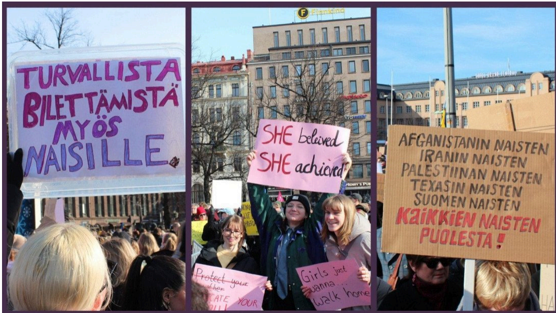
Kuvat naistenpäivän marssilta.